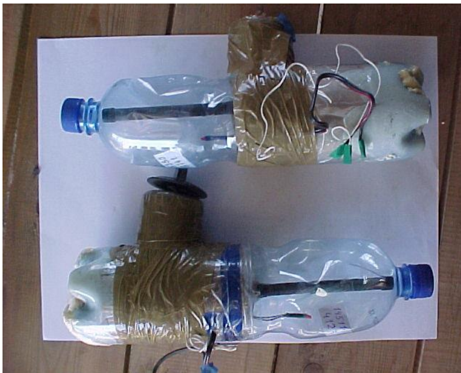
СВУ – корпус на основе пластиковой бутылки, с управлением по радиоканалу