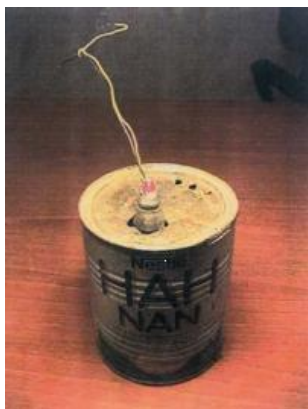
СВУ – корпус – жестяная банка с выведенным электродетонатором, заполненная ВВ