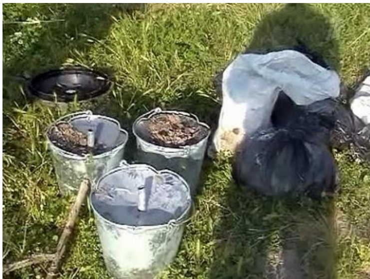
СВУ – корпус на основе металлического ведра, заполненного ВВ