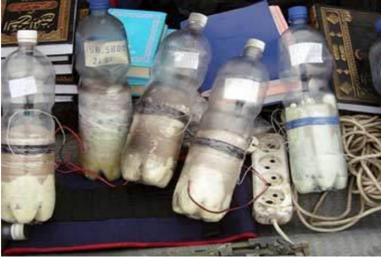
СВУ – корпус на основе пластиковой бутылки, заполненного ВВ