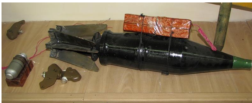
СВУ на основе штатных боеприпасов