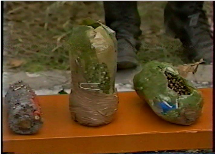
СВУ – корпус на основе пластиковой бутылки, заполненного ВВ с металлическими поражающими элементами