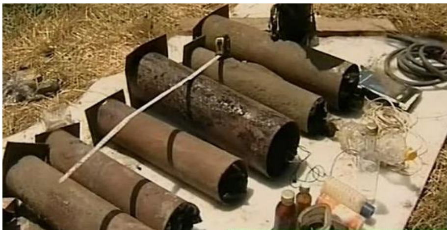
СВУ – корпус на основе отрезков металлических труб, заполненных ВВ